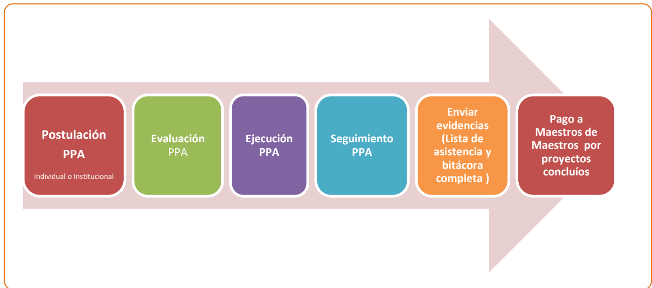
Diagrama: Fases de implementación Proyecto de Participación Activa

Una vez realizado el P.P.A el/la maestro/a debe: