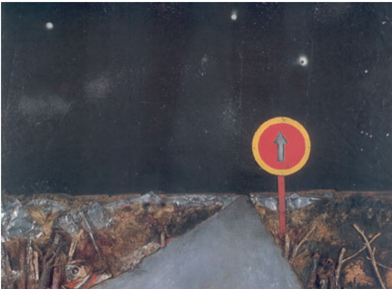
Camino bajo los faros, 1975.

Reconocer el compromiso y el punto de vista del artista, apreciando qué transmiten esos paisajes y contextos de pobreza y observando la desolación posmoderna y el basural de la exclusión.