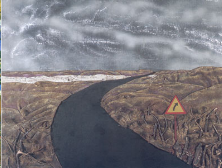
Camino bajo el cielo gris, 1975.